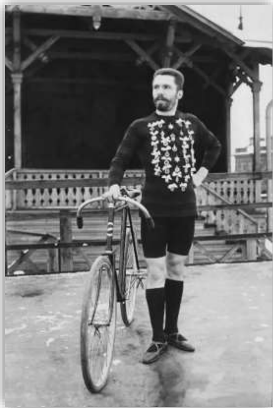
Победитель гонок Карл Булла. Между 1895 – 1910 годами, г. Санкт-Петербург.

В 1882 году в России разработаны «Обязательные постановления о езде на велосипедах», а в 1894 году опубликован Правительственный указ, который вводил в действие «Правила езды на велосипедах по городу».