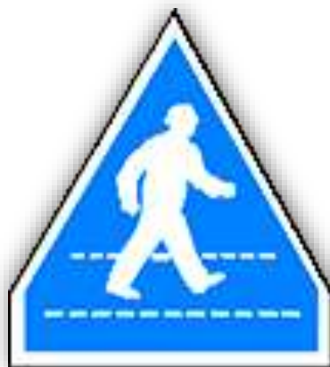
Е, 12 б