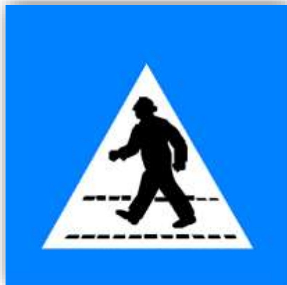
Е, 12 а