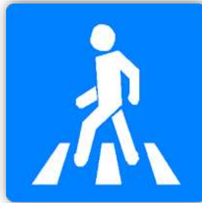
Е, 12 с