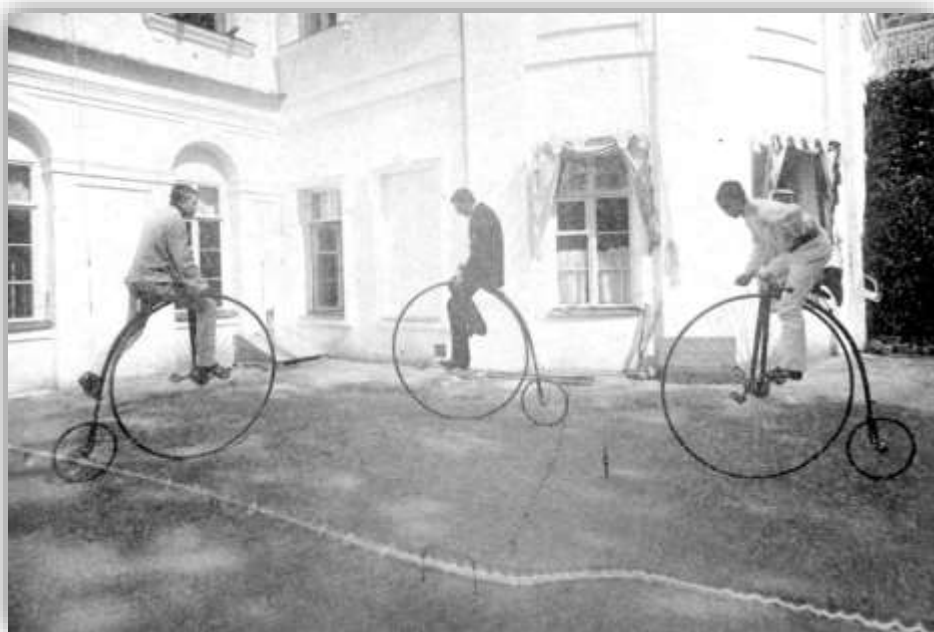
Катание на велосипедах в Михайловском. Ламберг, 1880-е годы, Московская губ., Подольский уезд.

В 1880 году в Москве прохожие стали свидетелями необычного происшествия. Человек, без особого труда удерживая равновесие, едет на велосипеде. Полицмейстер города был очень недоволен скоплением народа, конных повозок, чьи седоки остановились посмотреть на чудное транспортное средство. На следующий день вышло указание о запрете езды на велосипеде, так как это пугает лошадей и людей. Такие же запреты были установлены и в других крупных городах.